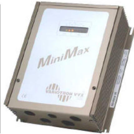
MiniMax VK IP 54