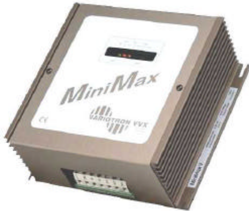
MiniMax V IP 20